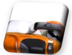
STIHL ERGOSTART Démarrage facile