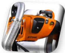
Moteur STIHL FS560 2,8 kW (3,8 Cv) 300 min-1