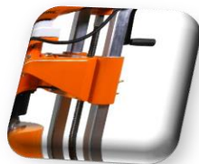
Guidage du chariot par Glissoirs téflon