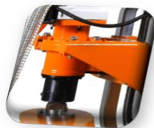
Réducteurs planétaires sans entretien