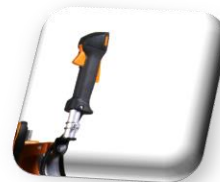
Poignée de Gaz Homme mort